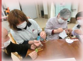
共同作品制作 (季節の飾り制)