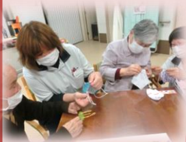
共同作品制作 (季節の飾り制)